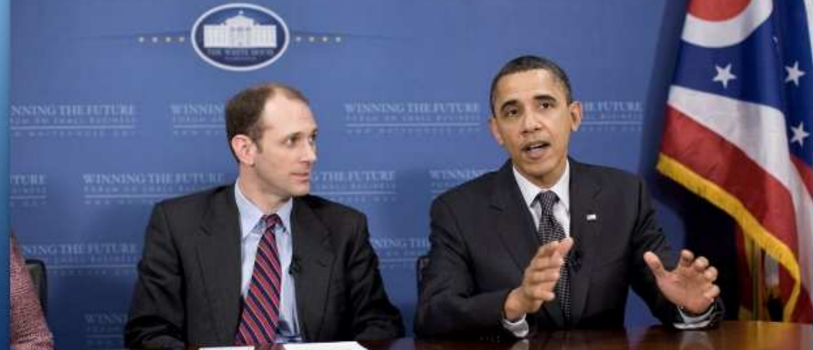
White House Photo, Chuck Kennedy, 2/22/11